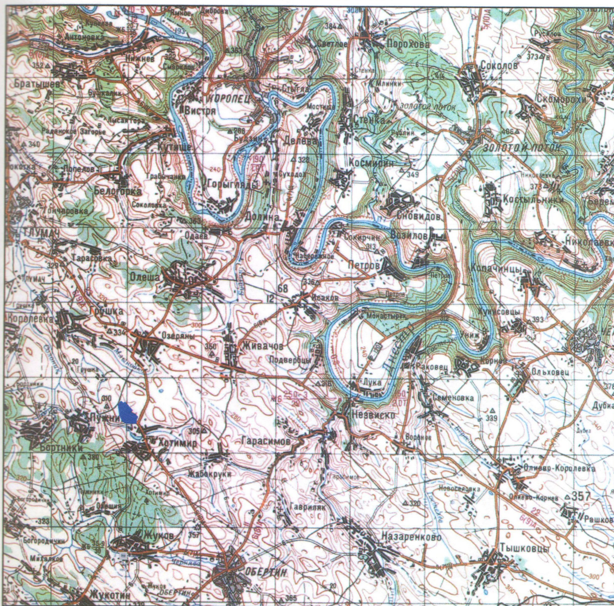
Оглядова карта Масштаб 1: 200 000

“Про відмову у наданні погодження на отримання спеціального дозволу на користування надрами з метою геологічного вивчення гіпсів ділянки Хотимирська, що знаходиться в Івано-Франківському районі Івано-Франківської області”